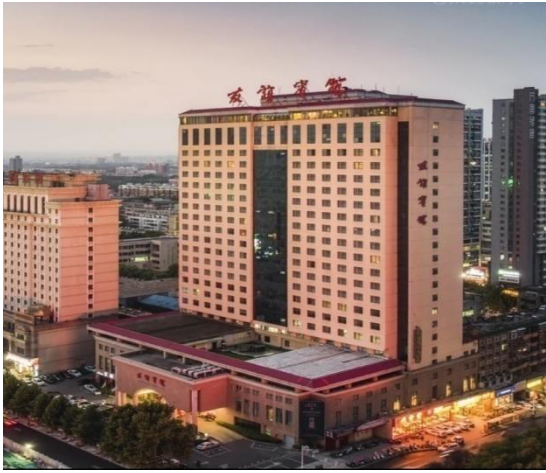
图 2 酒店外观