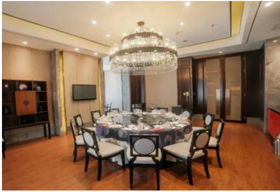
图 7 桌餐厅