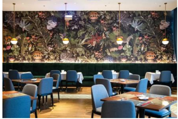
图 8 自助餐厅