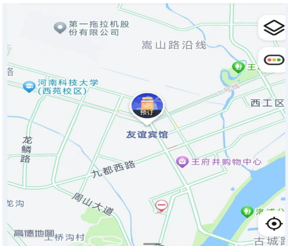
图 1 酒店位置图

洛阳友谊宾馆以亲情化服务为宗旨，为宾客提供一流的住宿、餐饮服务，同时赠予每位宾客温馨的感受及美好的回忆。