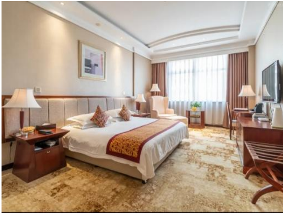
图 4 大床房