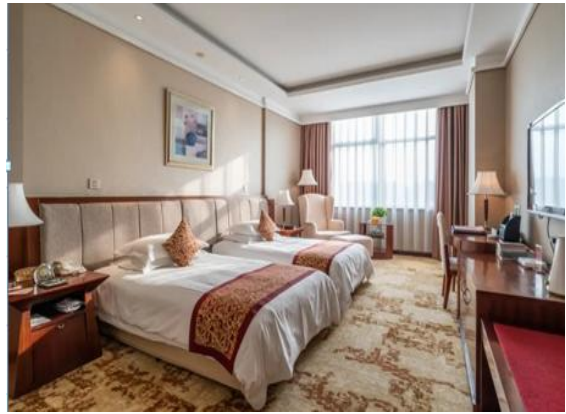
图 5 双床房