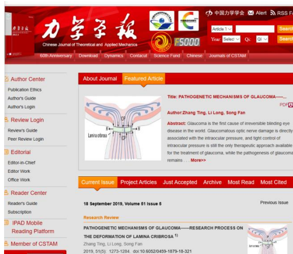
力学学报英文网站

在力学学报期刊网站上多种展现形式，增加文章的曝光度：HTML发布，专题文章、 精品文章、浏览排行、引用排行、多维度评价等等。创建了力学学报英文网站： http://lxxb.cstam.org.cn/EN/0459-1879/home.shtml 。