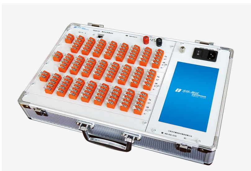
附图三 静态电阻应变仪