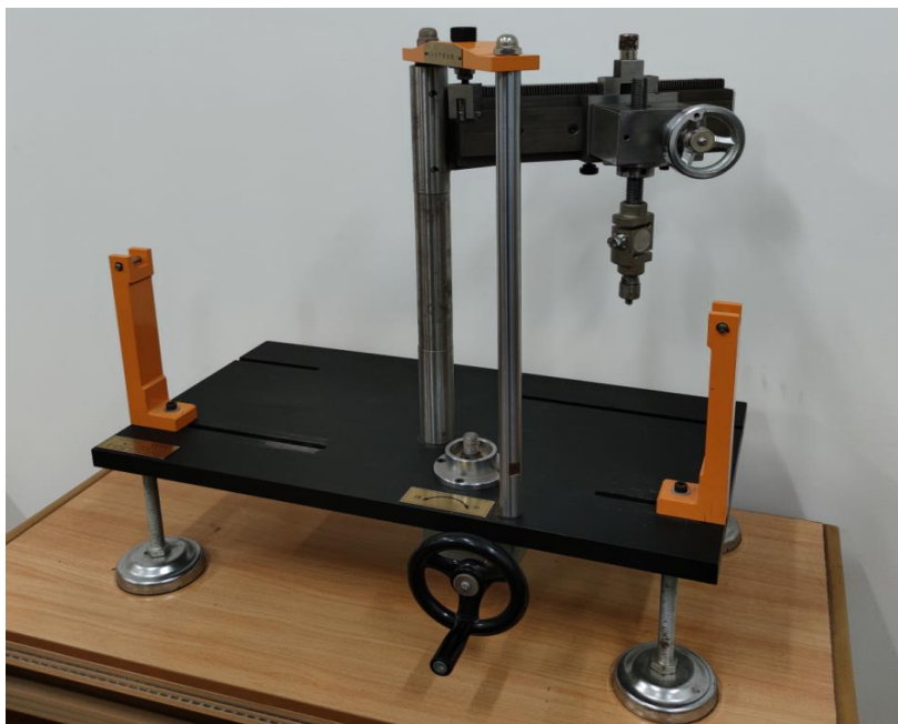
附图二 实验加载设备