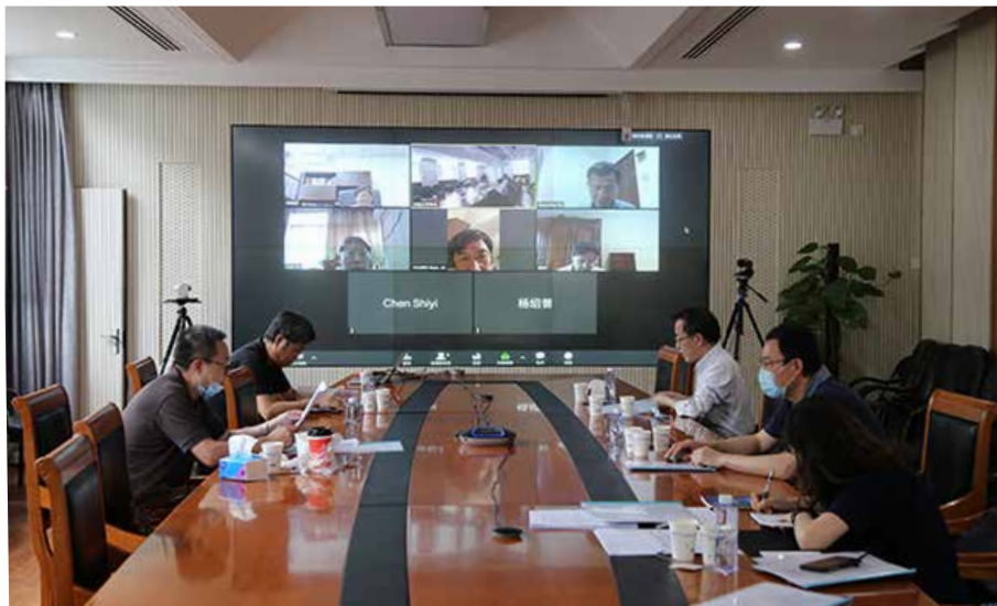
■ 中国力学学会秘书处 / 供稿