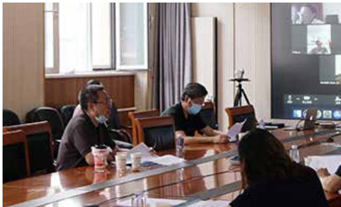
■ 中国力学学会秘书处 / 供稿

学会正在进行 2020 年度高等学校科学研究优秀成果奖（科学技术）青年科学奖的推荐工作，会议建议适当考虑女性和西部人选，由常务理事会议投票后上报。