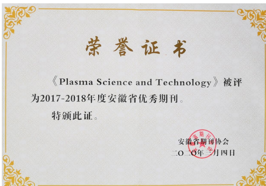
PST 被评为安徽省优秀期刊